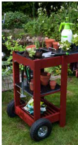
Variante 2: Gärtnermobil