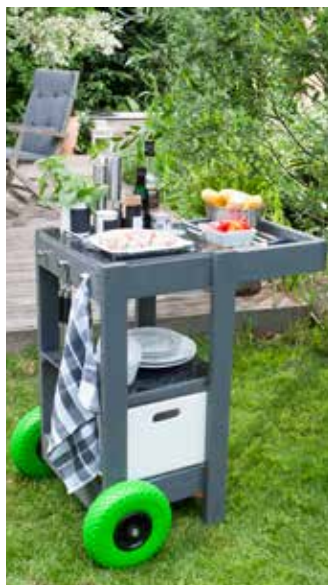
Variante 1: Grillhelfer