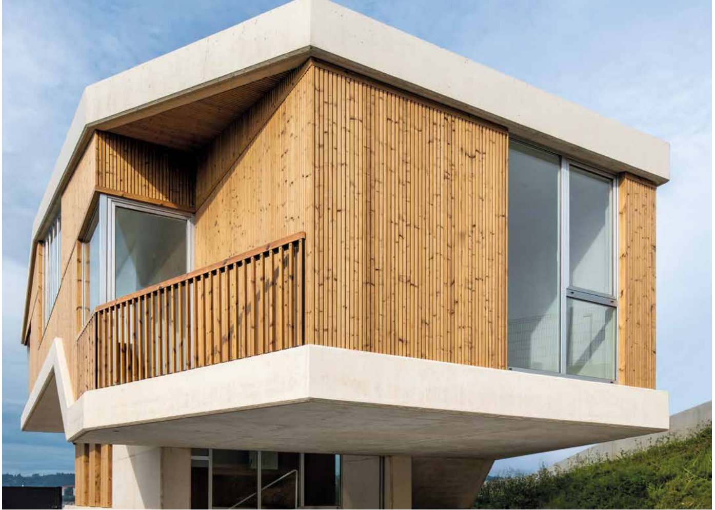
Casa en Perillio by Seara Peleteiro Arquitectos

Fassadenprofil Triple, Thermoholz Fichte gehobelt