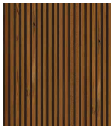
Thermoholz Kiefer Trio, gehobelt 26 × 92