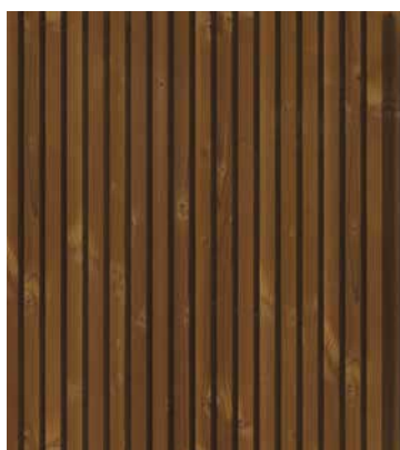
Thermoholz Fichte Triple, gehobelt 32 × 140