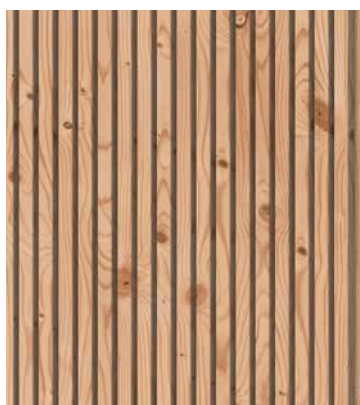
Kanadische Douglasie Triple, gehobelt 27 × 144