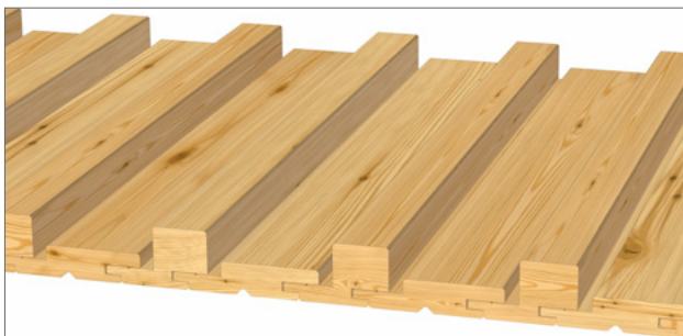
Gestaltungsvorschlag 3: 1x 21x96 mm, 1x 40x68 mm