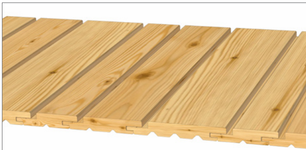
Gestaltungsvorschlag 2: 1x 21x96 mm, 1x 21x121 mm, 1x 21x146 mm