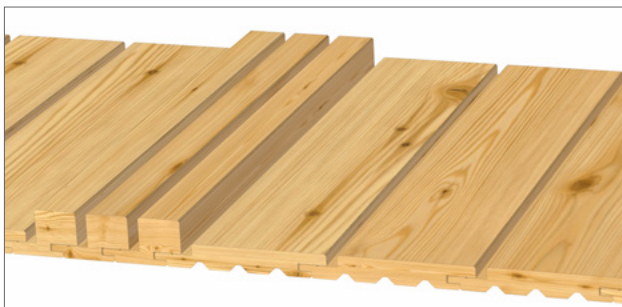
Gestaltungsvorschlag 1: 3x 40x68 mm, 3x 21x146 mm